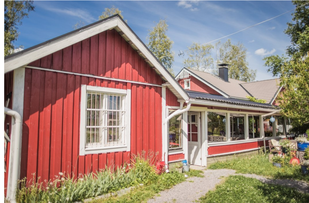
Kuva: Laura Vanzo, Visit Tampere